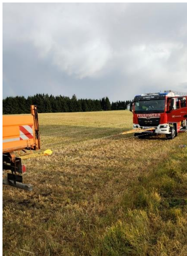
Seilwinde / Greifzug